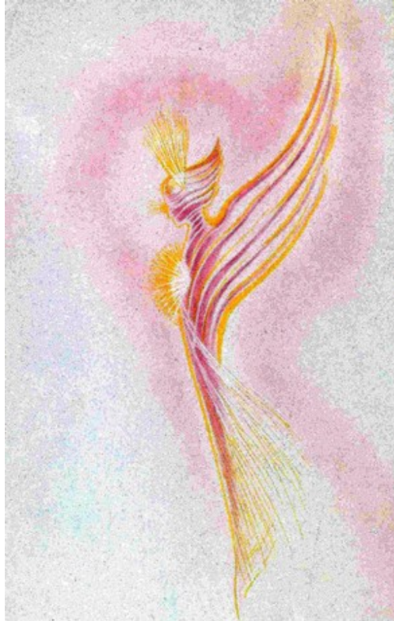
Un Deva rosa guaritore

Gli angeli guaritori agiscono sul corpo eterico e astrale del malato aiutandolo nel processo di guarigione. C'è una classe molto potente di angeli guaritori e sono quelli violetti del Settimo Raggio: magia e cerimoniale. Il Sesto Raggio è il Raggio della devozione, dell'aspirazione verso l'alto e porta energia dalla materia allo Spirito. Il Settimo Raggio invece è l'opposto, partendo dallo Spirito, raggiunge la materia e concretizza, cristallizza l'idea, il progetto spirituale, perciò è il Raggio della guarigione per eccellenza. Non a caso San Ciro medico è rappresentato con un abito di colore viola.