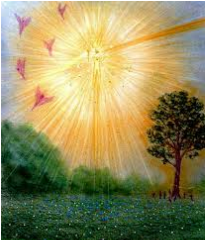
Questo è un Deva protettore di un albero

Vorrei ora ritornare un attimo al discorso precedente. Ci sono degli istruttori spirituali che parlano dei Deva come di esseri positivi e negativi (gli asura), che combattono tra di loro, usano astronavi tipo Star Treck per venire sulla Terra o gigantesche astronavi che poi una volta atterrate restano lì e vengono trasformate in templi. Secondo gli insegnamenti di Eugenio Siragusa, non ci sono nel Cosmo esseri intelligenti distruttivi in grado di danneggiare o distruggere l'ordine del Creato. Esiste è vero il male nelle civiltà di terza dimensione bassa come la nostra, ma questo ha la funzione di far evolvere gli esseri ed è previsto dall'ordine naturale del Creato come è stato esposto con tanta saggezza da Helena Petrovna Blavatsky nella Dottrina Segreta. Queste civiltà non possono interferire con la nostra se non è previsto dall'ordine naturale e dal Karma planetario. Se gli abitanti di qualche pianeta tecnologicamente avanzato volessero andare a conquistare altri pianeti senza che questo fosse previsto da un progetto karmico evolutivo, il progetto sarebbe subito fermato dalle Potenze Celesti e non avrebbero modo di attuarlo. Se ci appare a volte che il male prevarichi il bene è perché in questa dimensione il male ha una funzione evolutiva. Diceva Eugenio Siragusa che non si può conoscere la luce se non si conosce il buio e che non si può conoscere il bene se prima non si conosce il male.