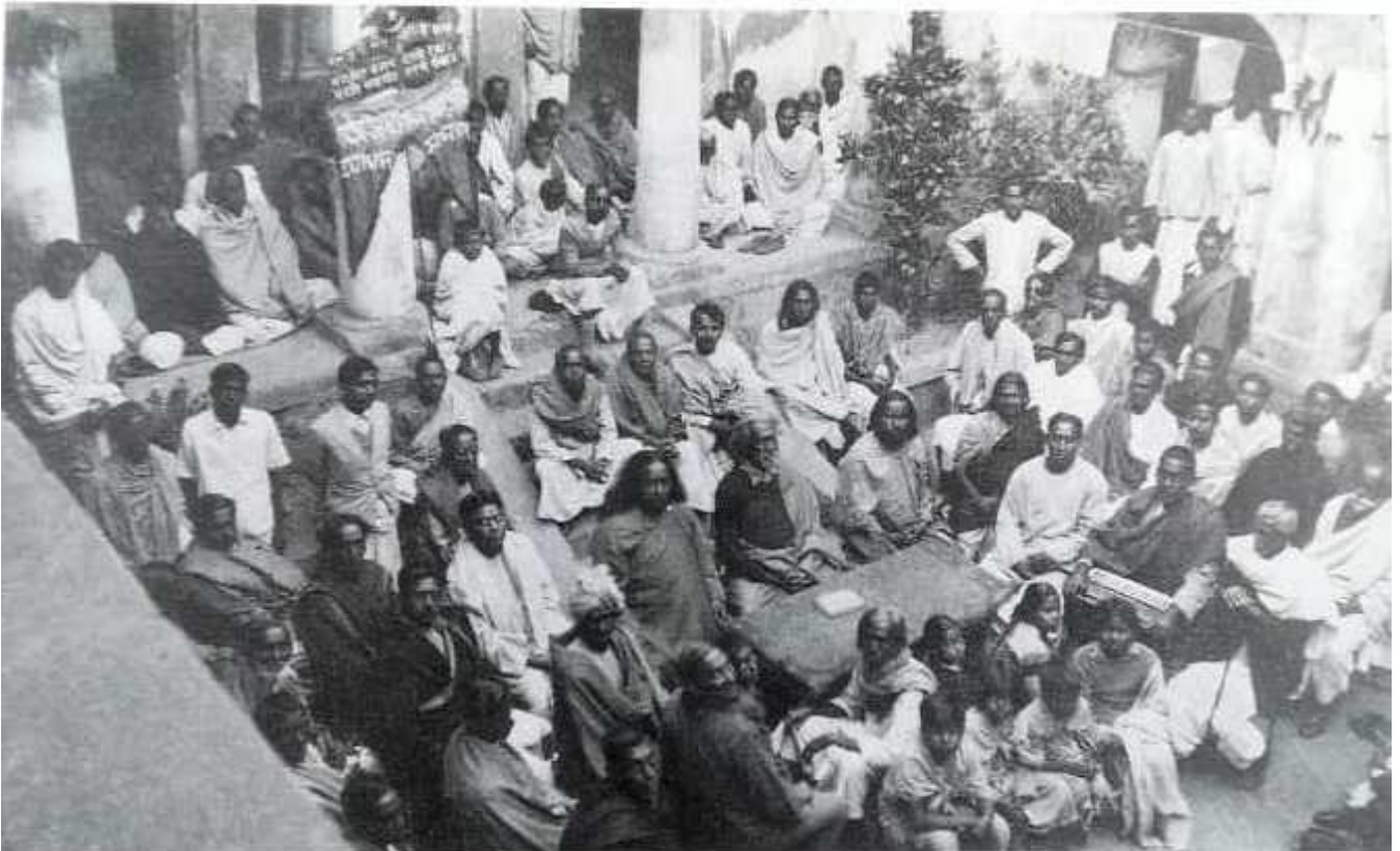
Lo Swami Sri Yukteswar e Paramahansa Yogananda durante la cerimonia religiosa condotta nel dicembre del 1935 nell' āśram di Sri Yukteswar a Serampore. Il giorno seguente, il grande guru affidò all'amato discepolo la responsabilità di occuparsi dei suoi āśram e di proseguire la sua opera spirituale: "Il mio compito sulla terra è ormai terminato. Sei tu che dovrai occupartene ora... Lascio tutto nelle tue mani".

È da notare, inoltre, che in alcuni casi la consonante v, immediatamente dopo altre consonanti, subisce una certa attenuazione, e si pronuncia come una u: svarga andrebbe letto suarga, ecc.