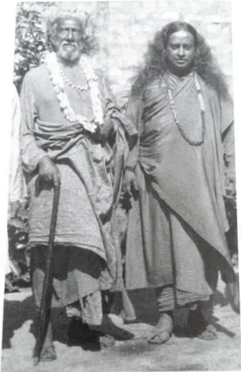
Lo Swami Sri Yukteswar e Paramahansa Yogananda, Calcutta, 1935